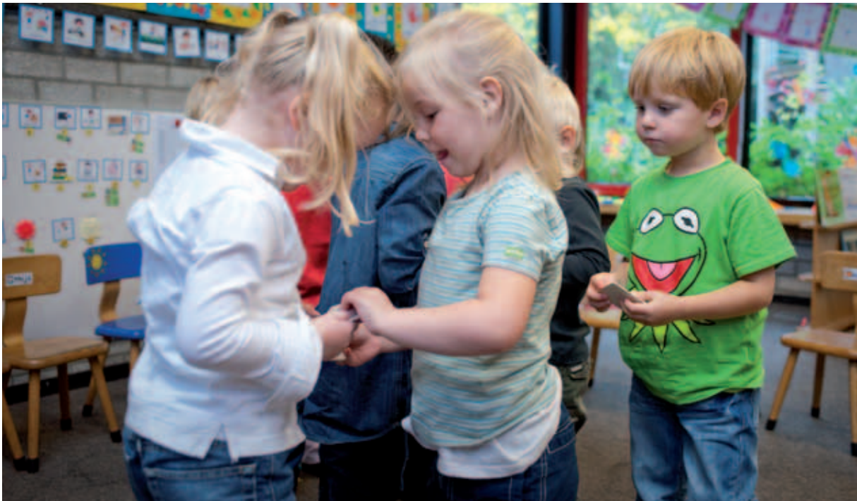
Wij hebben allebei een koe