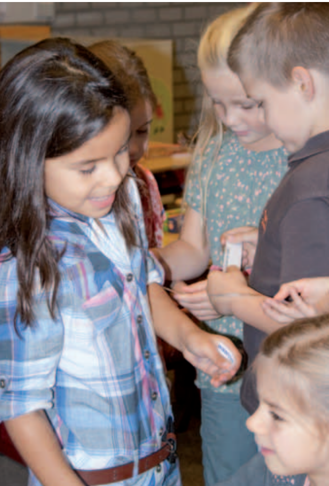
"Weet jij wat een loodgieter is?"

In dit doorkijkje zie je dat de werkvorm Zoek iemand Die ook goed ingezet kan worden bij een klas met grote niveaoverschillen.