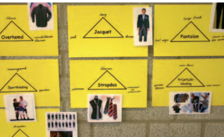
Soorten kleding in beeld

In dit doorkijkje zie je hoe je in zeer korte tijd de betekenis van woorden centraal kunt stellen, zodat kinderen een tekst beter begrijpen. Er is sprake van oppervlakkige woordkennis omdat deze in principe niet verder uitgediept en geconsolideerd wordt. Soms helpt het om een tegenstelling of een synoniem op te schrijven. Je helpt kinderen enorm door hen daarop te wijzen en aan te moedigen om dat zelf ook eens uit te proberen.